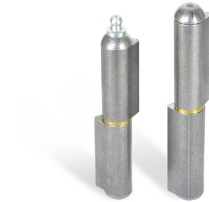
ST / STS / MS 型